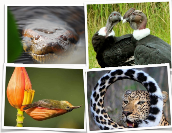
Die Archetypen der vier Himmelsrichtungen.

(Marc B. Axiala, Psychedelic Integration)